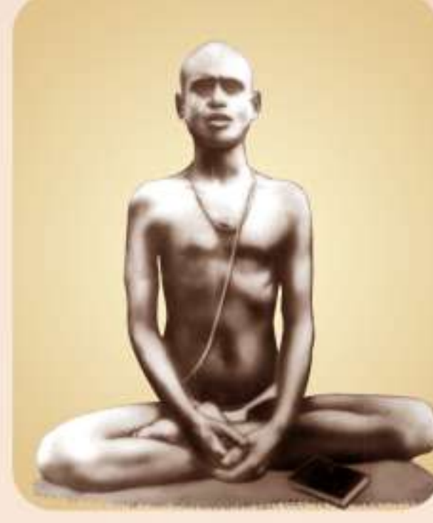
શ્રી સદ્ગુરુપરમાત્માને નમઃ :