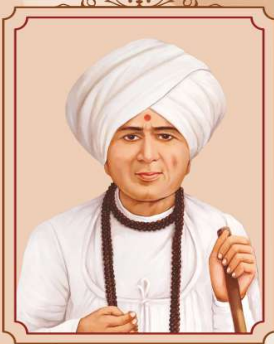
પરમ પૂજ્ય સંતશ્રી જલારામ જાપા પિરપુર