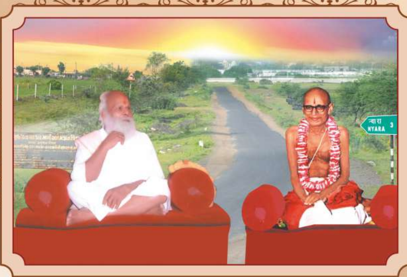
અચ્છા કામ કરતે હો, અચ્છા કામ કરતે રહો. આજ તુમ્હારા મંગલ પ્રભાત હૈ, લગવાન તુમ્હારા મંગલ કરે.